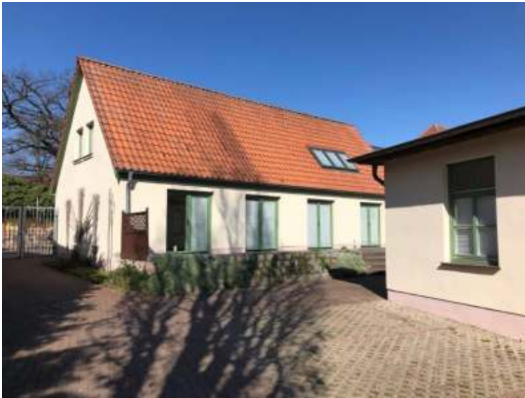
Wohn- und Geschäftshaus vom Innenhof