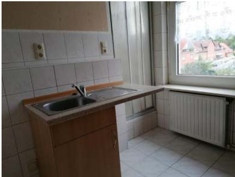
Küche mit Dusche