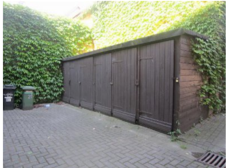
Hofanlage mit Schuppen