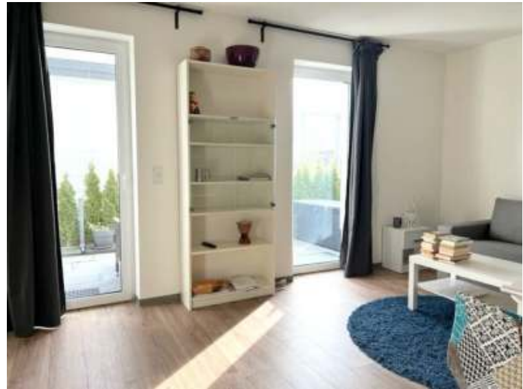
Wohnzimmer mit offener Küche