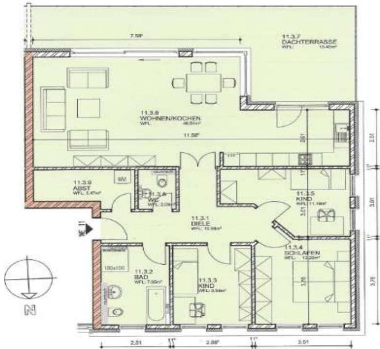
4-Raum Wohnung WFL: 122,87 m 2