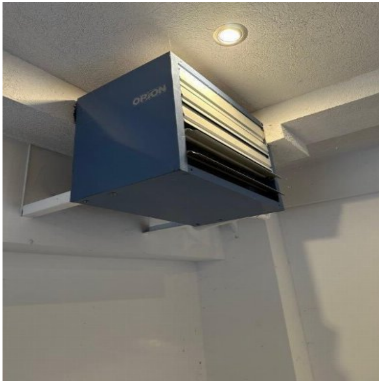
Luftheiz- und Luftkühlgerät