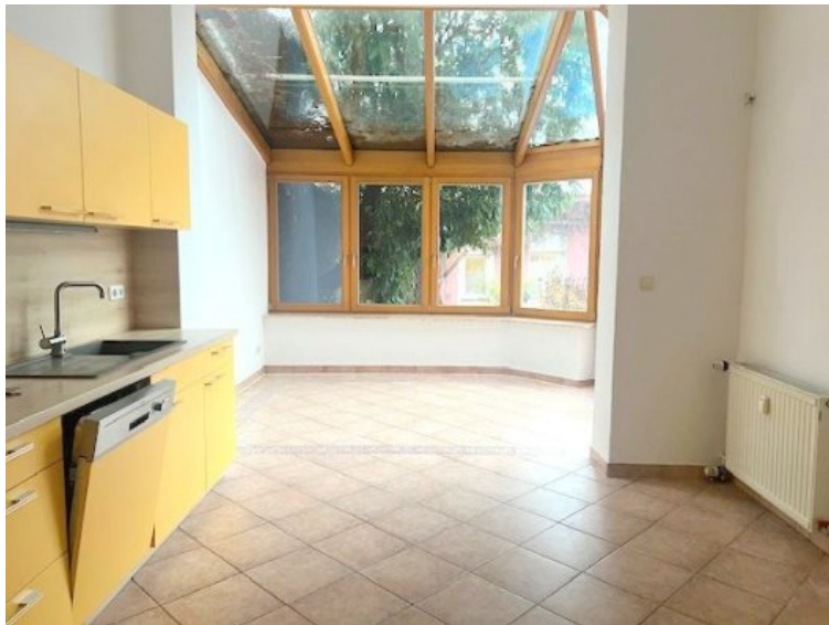
Küche mit Wintergarten