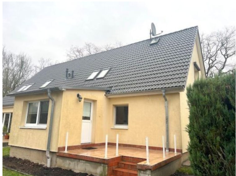
Hausansicht/ freie Doppelhaushälfte