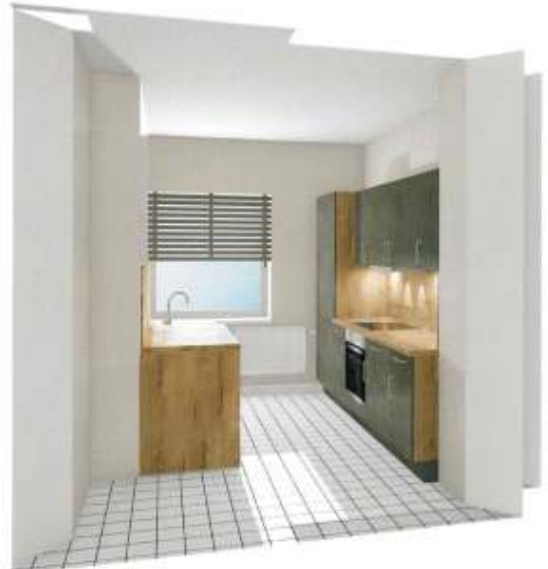
Skizze neue Küche