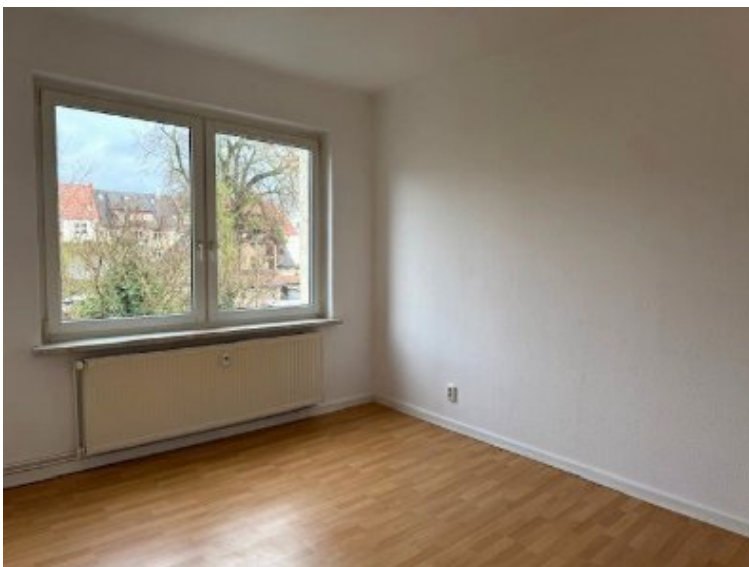
Whg. 1. OG