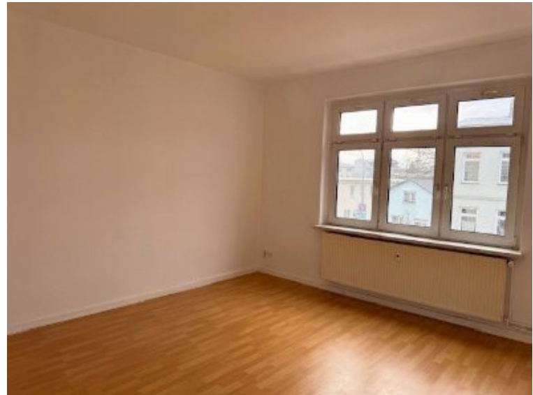
Whg. 1. OG