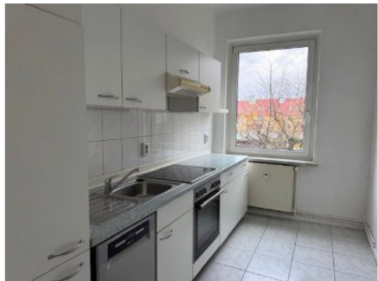
Whg. 1. OG