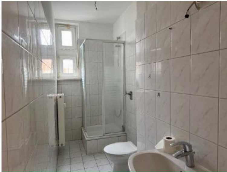
Whg. 1. OG