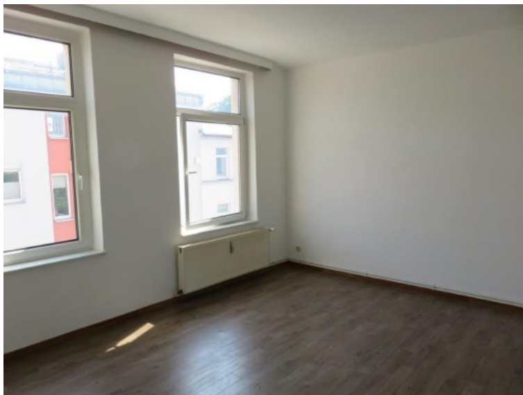
Whg. 2. OG