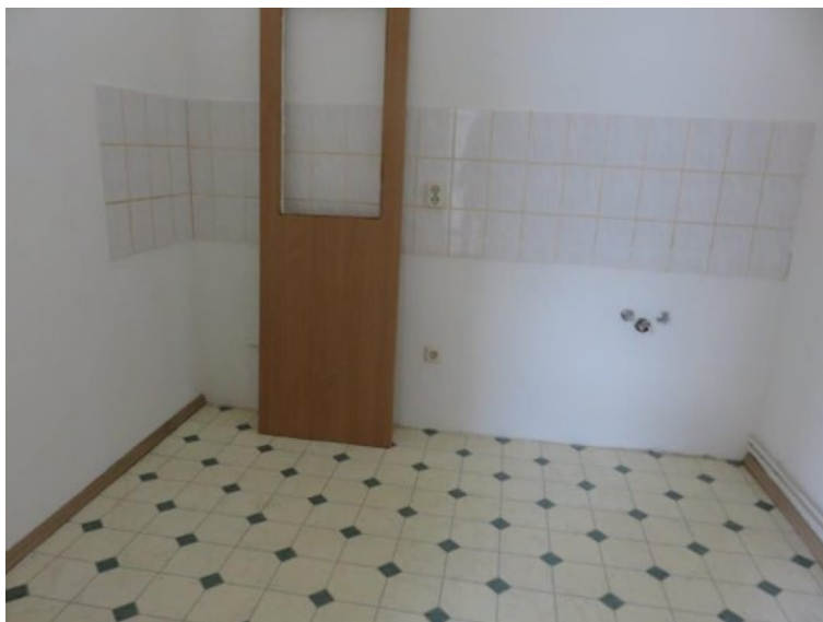
Küche 2. OG