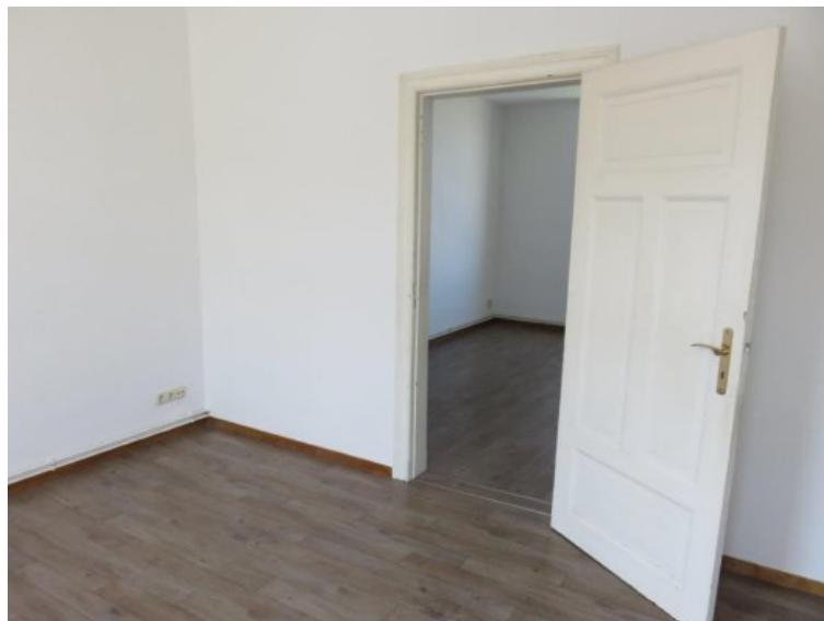
Whg. 2. OG