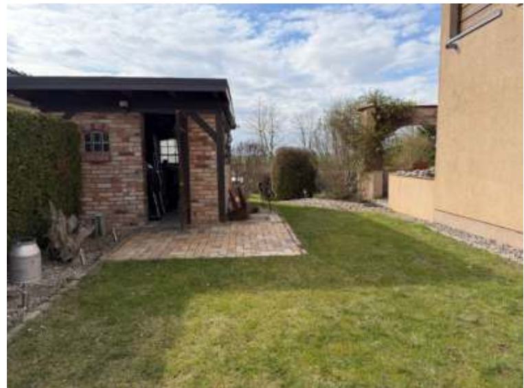
Hof / Schuppen