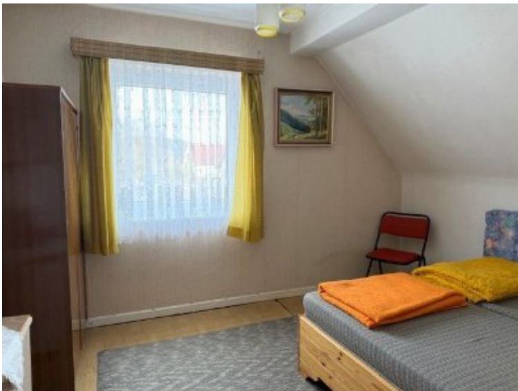
Schlafzimmer 2 Obergeschoss