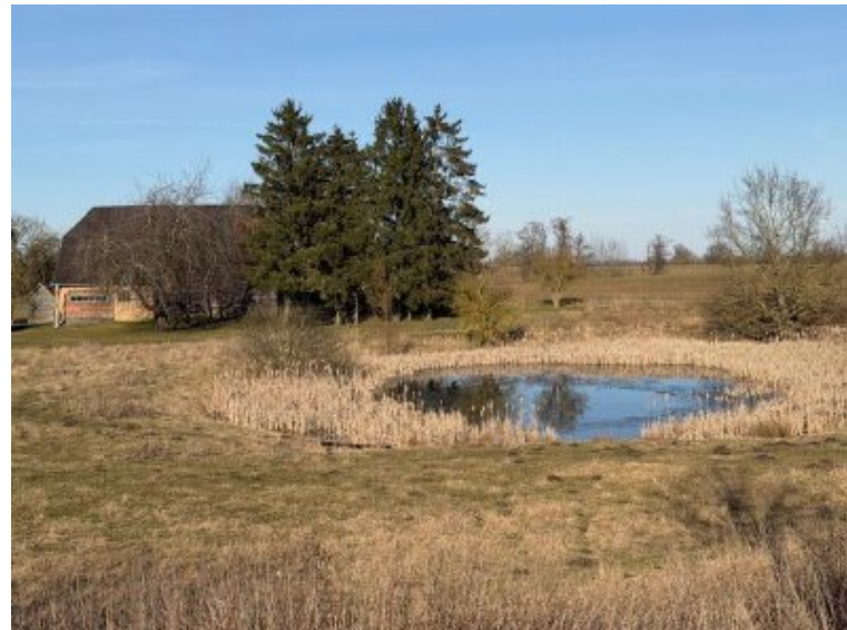
Grundstück mit Naturteich