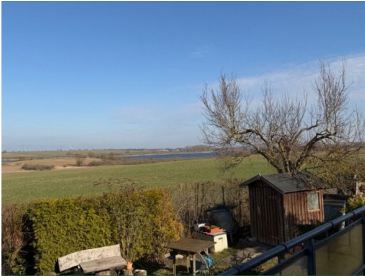
Blick auf den See