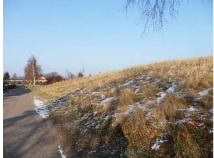
Ansicht der Grundstücke