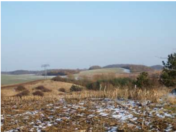
Blick vom Grundstücksende