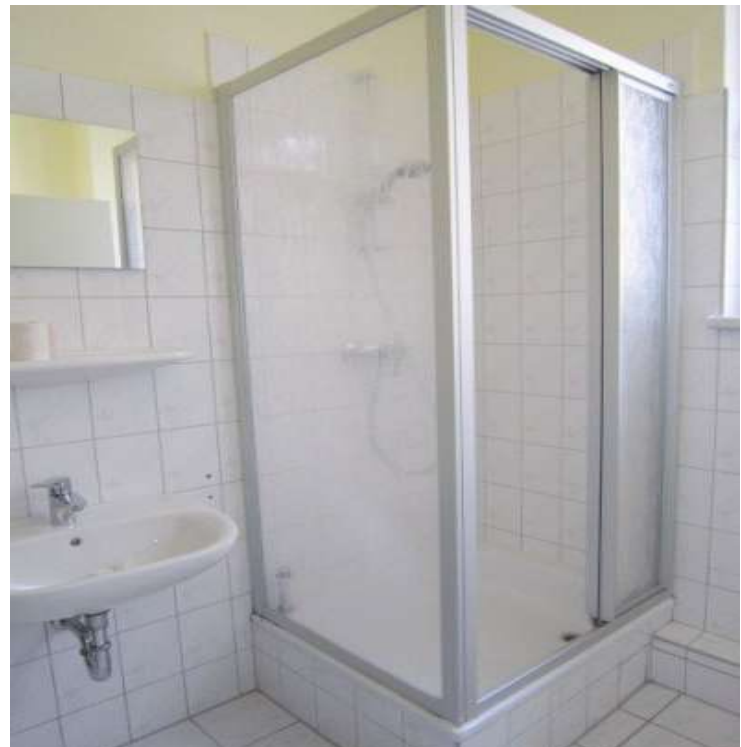
Bad mit Dusche und Fenster