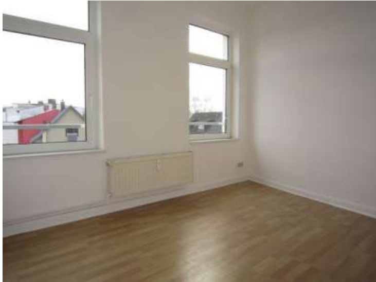
Zimmer Nr. 3