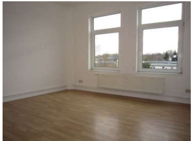
Zimmer Nr. 2