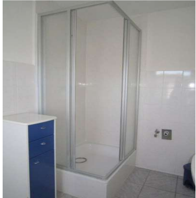
Bad mit Dusche und Fenster