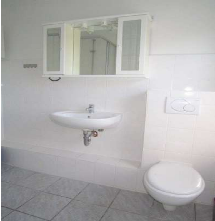
Bad mit Dusche und Fenster