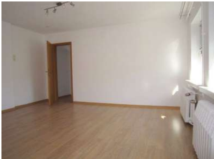
Zimmer Nr. 2, 2. Ansicht