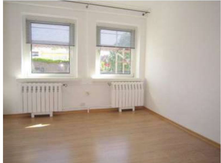
Zimmer Nr. 1