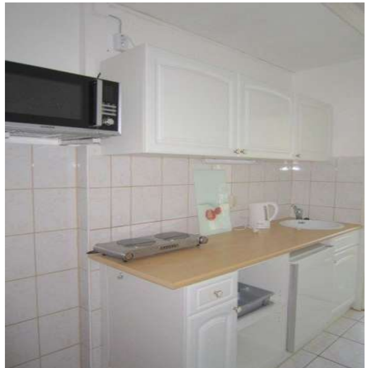
Küche mit EBK