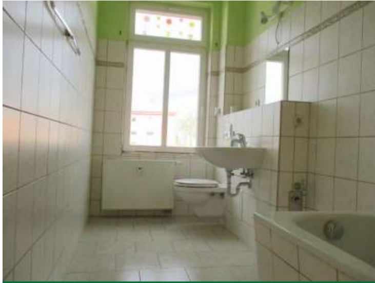
Bad mit Wanne und Fenster