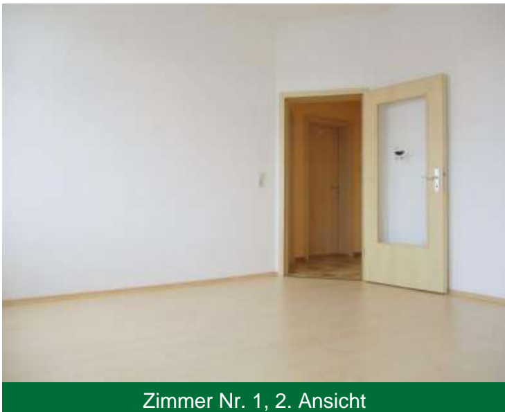
Zimmer Nr. 1, 2. Ansicht