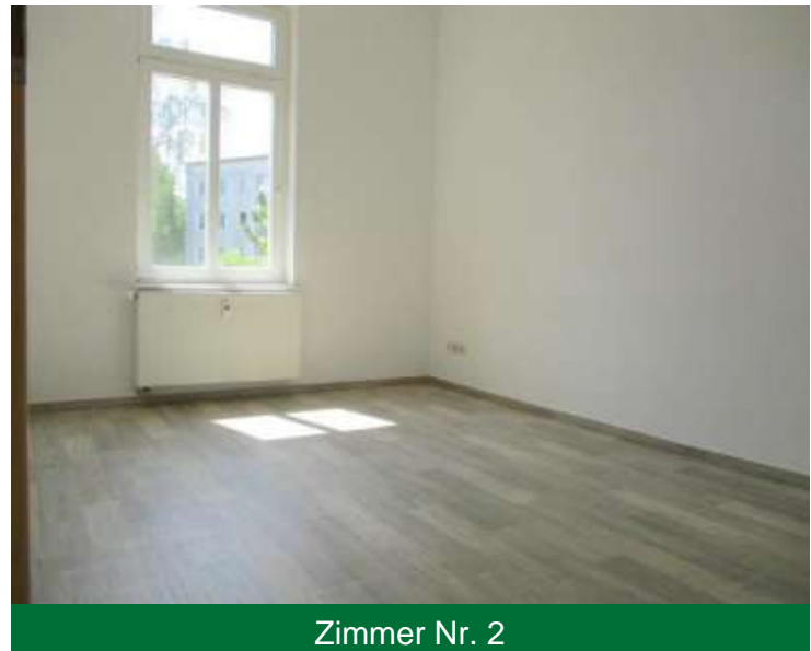
Zimmer Nr. 2