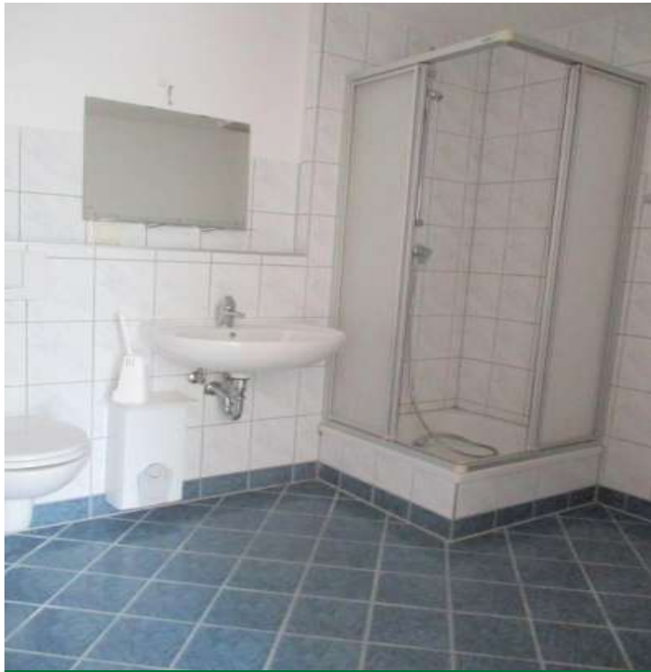
Bad mit Dusche