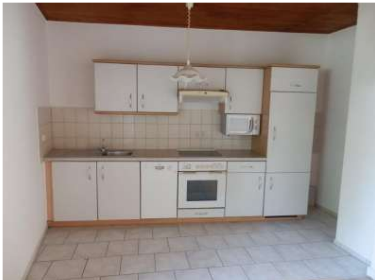
offene Küche mit EBK