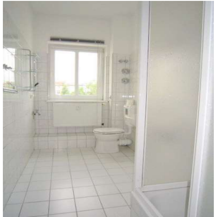
Bad mit Dusche und Fenster