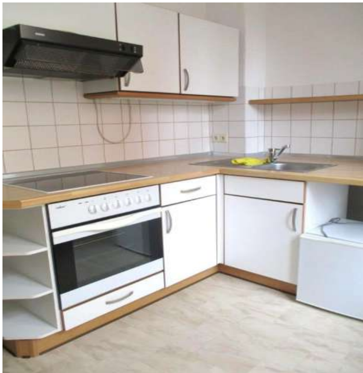
Küche mit EBK