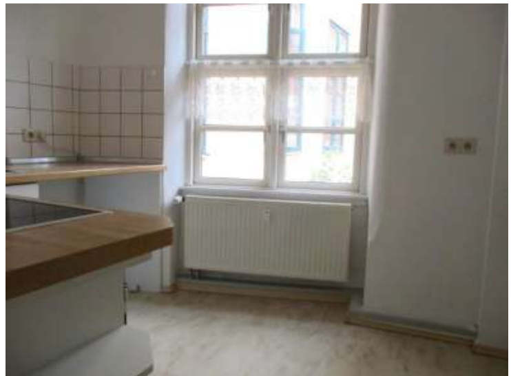
Küche mit EBK