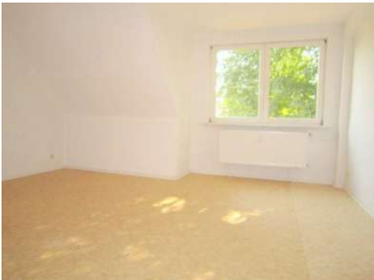
Zimmer 1, 2. Ansicht