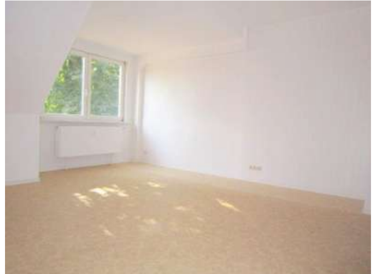
Zimmer 1, 1. Ansicht