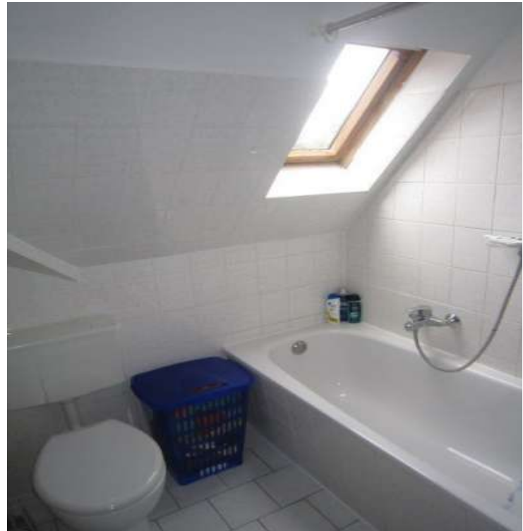
Bad mit Wanne