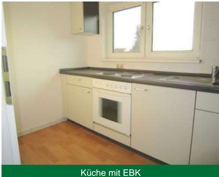
Küche mit EBK