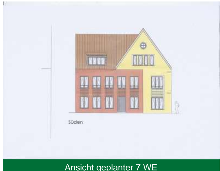
Ansicht geplanter 7 WE