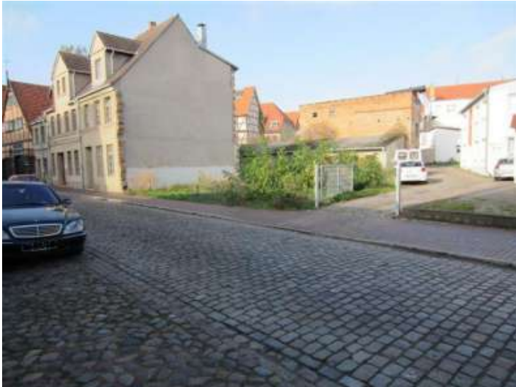
Lage in der Straße